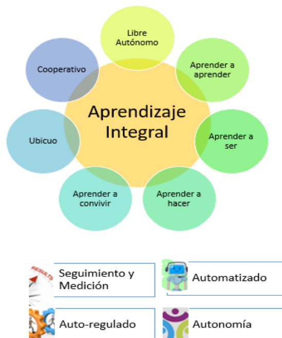
Figura 2. Programa REDIZAJE/Aprendizaje Integral