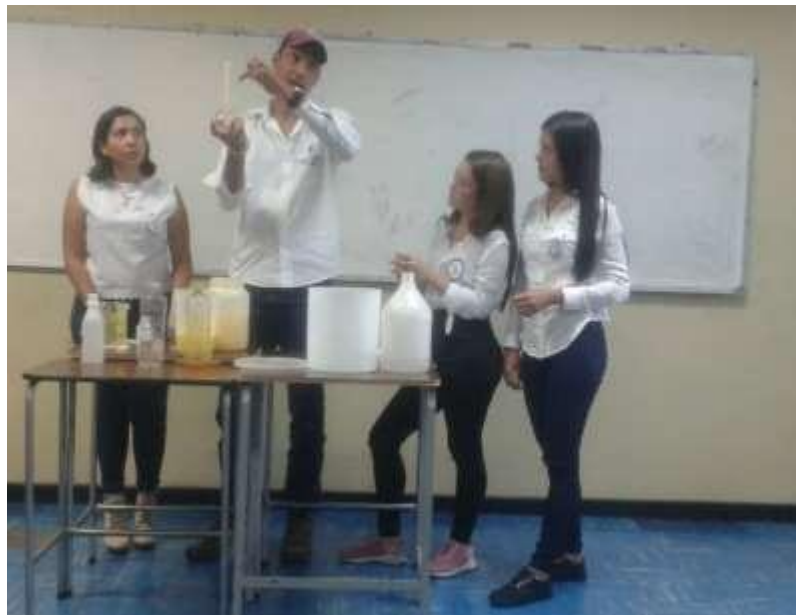
FOTOGRAFIA N° 5: PARTICIPACION E INTEGRACION DE LAS ALUMNAS EN LA EXPLICACION