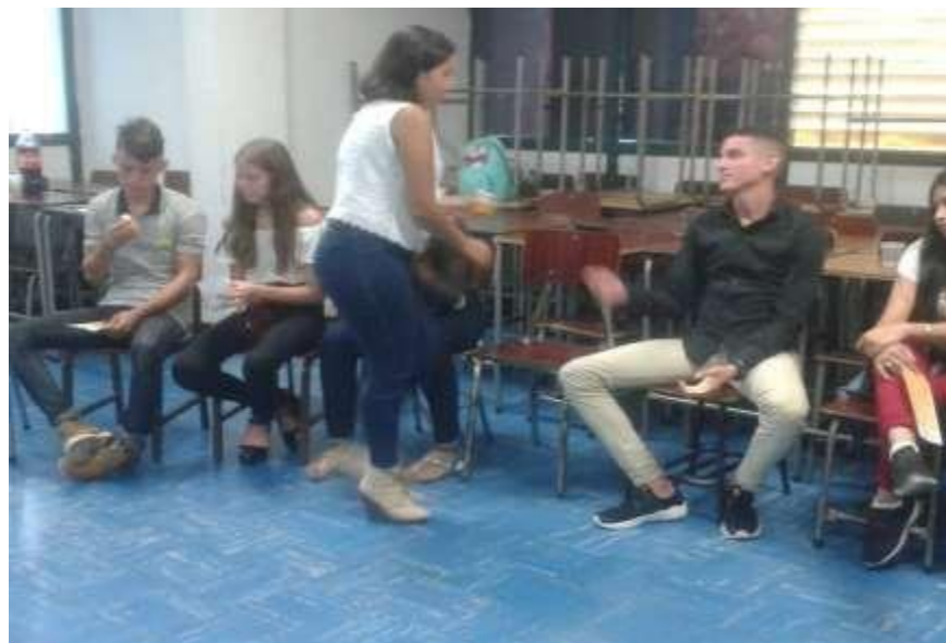
FOTOGRAFIA N° 6: ENTREGA DEL PRODUCTO TERMINADO A LOS PARTICIPANTES