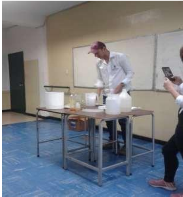
FOTOGRAFIA N° 4: MOMENTO EN QUE SE DE INICIO AL TALLER DE ELABORACION DE SHAMPOO