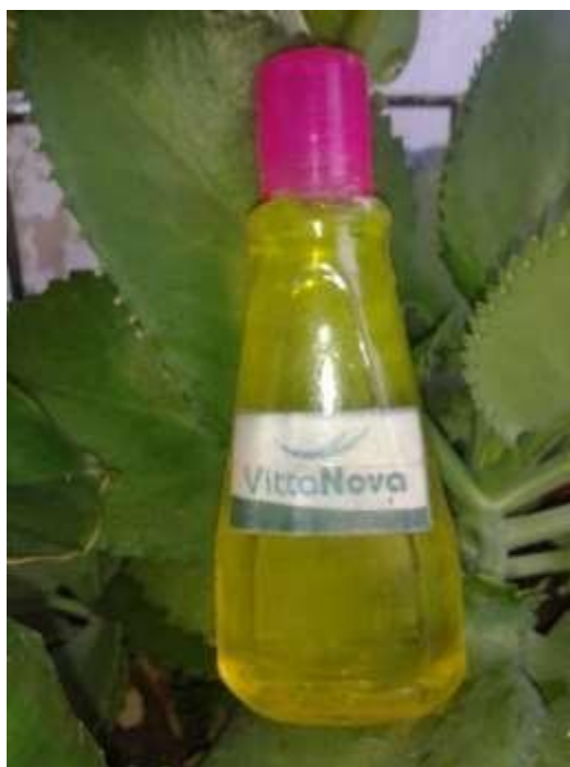
FOTOGRAFIA N° 7 PRODUCTO FINAL