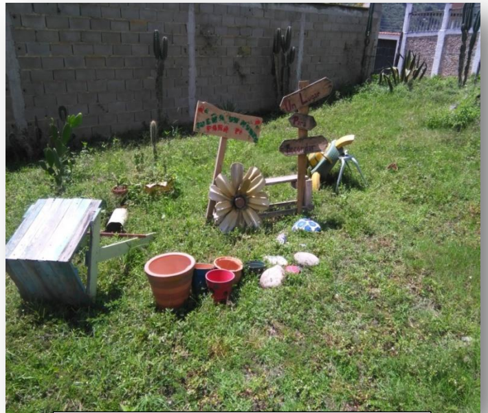
Materiales de decoración.