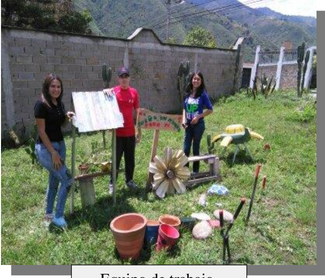
Equipo de trabajo.