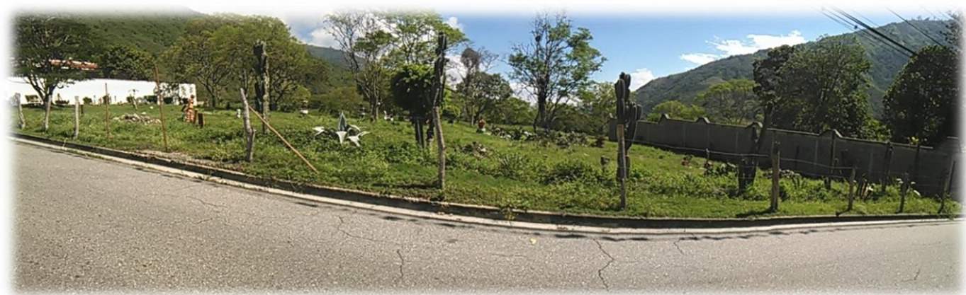
Terreno desde el exterior.