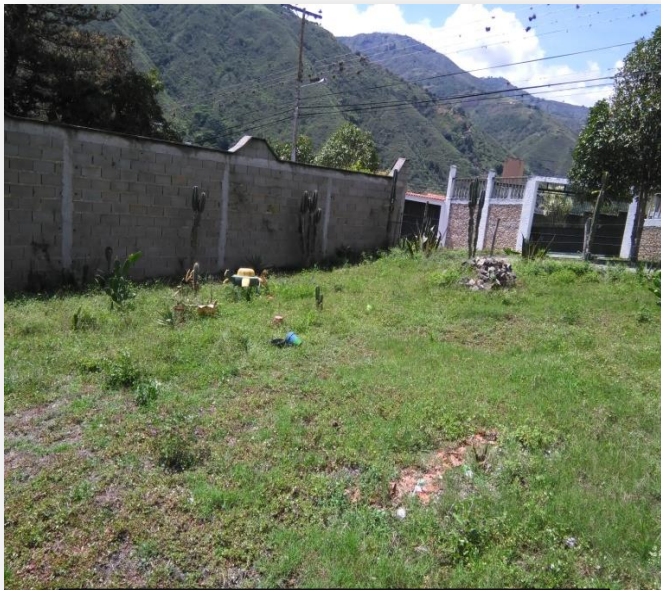
Terreno desde el interior.