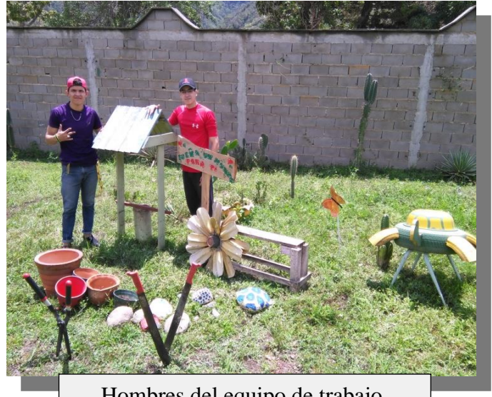
Hombres del equipo de trabajo.