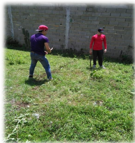
Primer mantenimiento del terreno antes de la defensa.