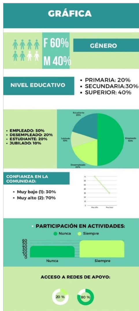
Figura 1. Expresión gráfica de los resultados.

los resultados alcanzados y fortaleció las bases para futuras iniciativas de investigación y acción comunitaria.