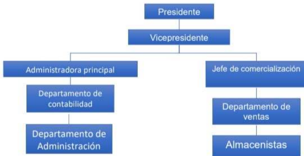
Figura 01. Estructura Organizacional de Distribuidora Goddy Plast, C.A.