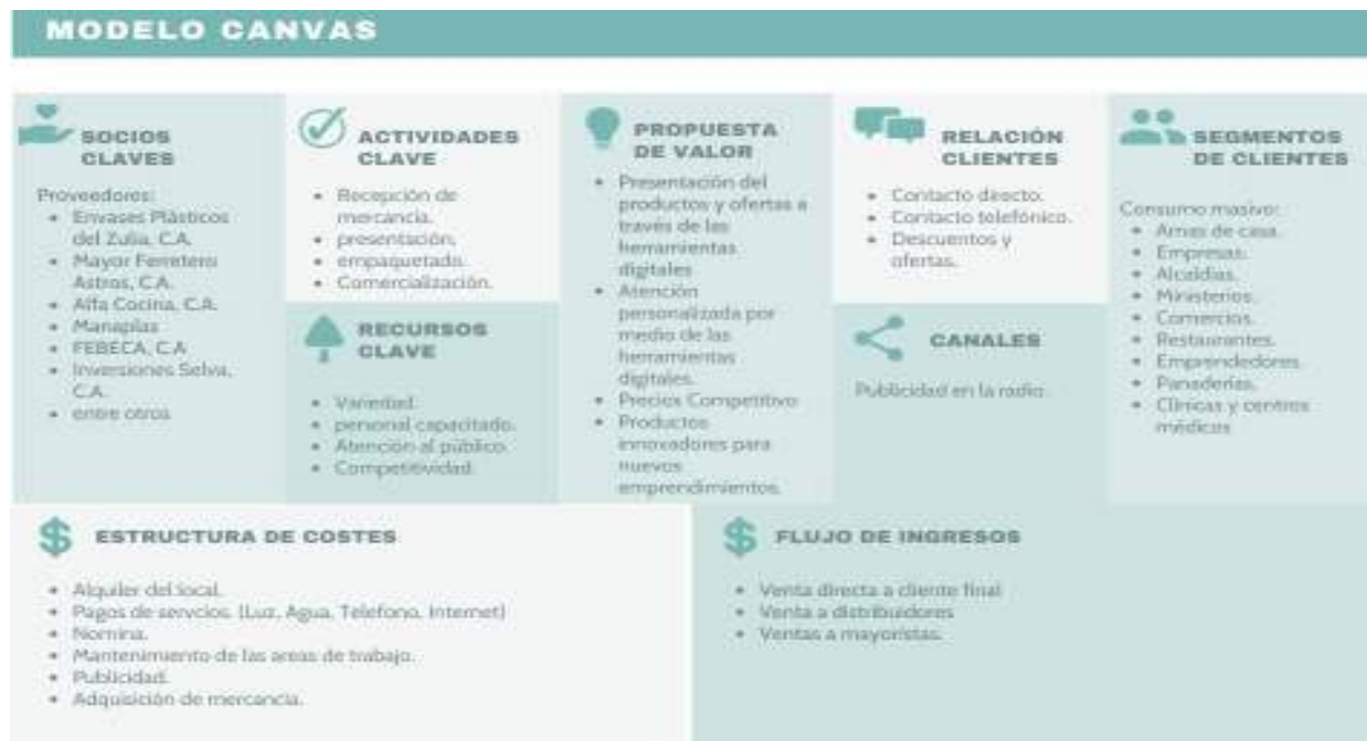
Figura 2 Modelo de negocio CANVAS